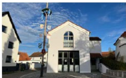
Feuerwehrhaus Mühlhausen Schustergaßl 2