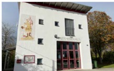
Feuerwehrhaus Hagau Rosenschwaigstraße 105