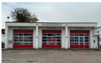
Feuerwehrhaus Haunwöhr Oberfeldstraße 6