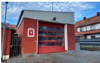
Feuerwehrhaus Friedrichshofen Friedrichshofener Straße 26c