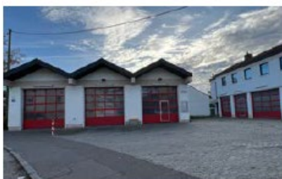
Feuerwehrhaus Etting Faberstraße 9