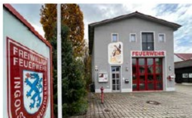
Feuerwehrhaus Hundszell Kirchstraße 23