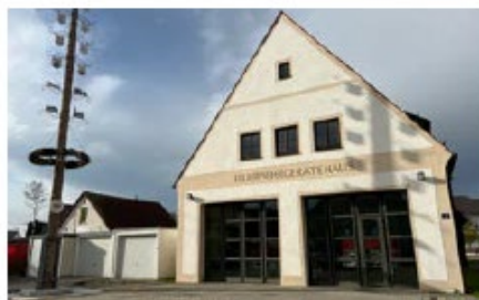
Feuerwehrhaus Zuchering Am Kühlhaus 4