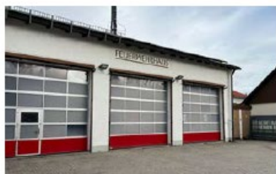
Feuerwehrhaus Unsernherrn Karl-Theodor-Straße 7