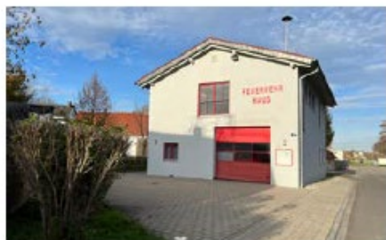
Feuerwehrhaus Pettenhofen Moosweg 9