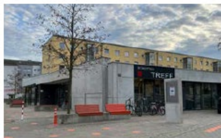
Stadtteiltreff Piusviertel Pfitznerstraße 19a