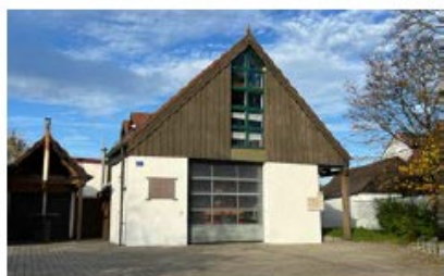
Feuerwehrhaus Dünzlau Mühlackerweg 2