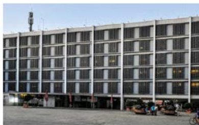
Neues Rathaus Rathausplatz 4