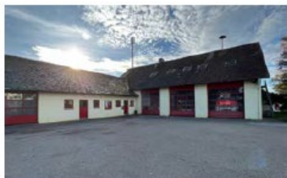
Feuerwehrhaus Gerolfing Barthlgasserstraße 7