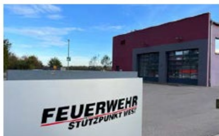
Feuerwehrhaus Irgertsheim Erchanstraße 36