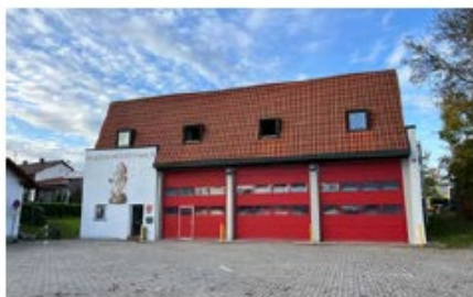
Feuerwehrhaus Mailing Am Seitweg 24