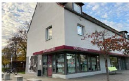
Stadtteiltreff Konradviertel Oberer Taubentalweg 65