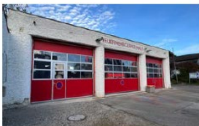
Feuerwehrhaus Haunstadt Weckenweg 25