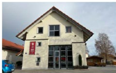
Feuerwehrhaus Brunnenreuth Robert-Koch-Straße 58