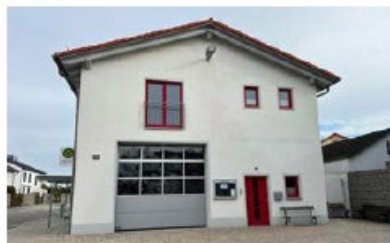
Feuerwehrhaus Rothenturm Unsernherrner Straße 31a