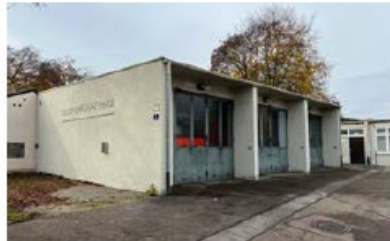
Feuerwehrhaus Ringsee Dahlienstraße 6