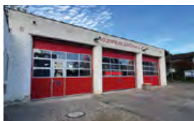
Feuerwehrhaus Haunstadt Weckenweg 25