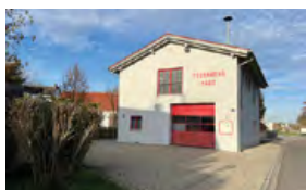
Feuerwehrhaus Pettenhofen Moosweg 9