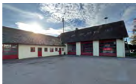
Feuerwehrhaus Gerolfing Barthlgasserstraße 7