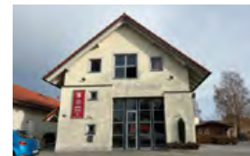
Feuerwehrhaus Brunnenreuth Robert-Koch-Straße 58