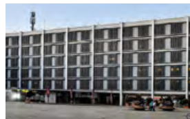
Neues Rathaus Rathausplatz 4