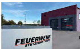
Feuerwehrhaus Irgertsheim Erchanstraße 36