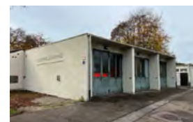
Feuerwehrhaus Ringsee Dahlienstraße 6