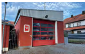
Feuerwehrhaus Friedrichshofen Friedrichshofener Straße 26c