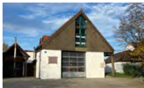
Feuerwehrhaus Dünzlau Mühlackerweg 2