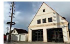
Feuerwehrhaus Zuchering Am Kühlhaus 4