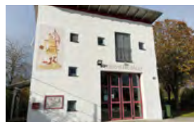
Feuerwehrhaus Hagau Rosenschwaigstraße 105