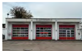
Feuerwehrhaus Haunwöhr Oberfeldstraße 6