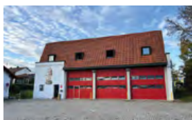
Feuerwehrhaus Mailing Am Seitweg 24