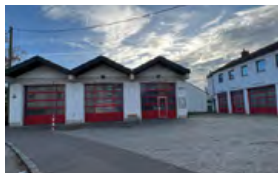
Feuerwehrhaus Etting Faberstraße 9