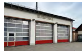
Feuerwehrhaus Unsernherrn Karl-Theodor-Straße 7