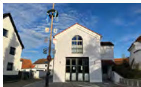
Feuerwehrhaus Mühlhausen Schustergaßl 2