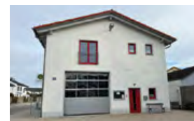
Feuerwehrhaus Rothenturm Unsernherrner Straße 31a