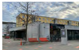
Stadtteiltreff Piusviertel Pfitznerstraße 19a