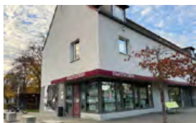
Stadtteiltreff Konradviertel Oberer Taubentalweg 65