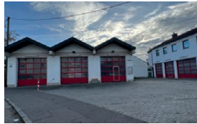
Feuerwehrhaus Etting Faberstraße 9