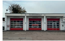
Feuerwehrhaus Haunwöhr Oberfeldstraße 6