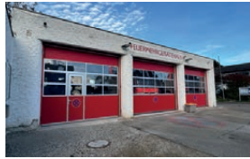
Feuerwehrhaus Haunstadt Weckenweg 25