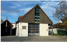
Feuerwehrhaus Dünzlau Mühlackerweg 2