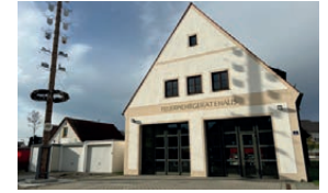
Feuerwehrhaus Zuchering Am Kühlhaus 4