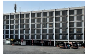
Neues Rathaus Rathausplatz 4