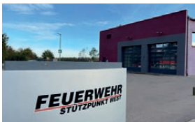
Feuerwehrhaus Irgertsheim Erchanstraße 36