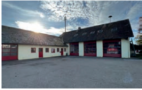
Feuerwehrhaus Gerolfing Barthlgasserstraße 7