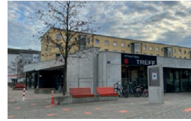
Stadtteiltreff Piusviertel Pfitznerstraße 19a