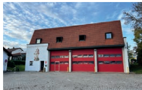
Feuerwehrhaus Mailing Am Seitweg 24