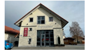
Feuerwehrhaus Brunnenreuth Robert-Koch-Straße 58