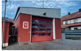
Feuerwehrhaus Friedrichshofen Friedrichshofener Straße 26c