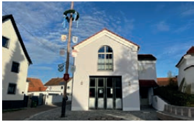
Feuerwehrhaus Mühlhausen Schustergaßl 2