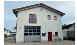
Feuerwehrhaus Rothenturm Unsernherrner Straße 31a