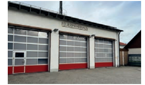
Feuerwehrhaus Unsernherrn Karl-Theodor-Straße 7