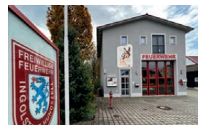
Feuerwehrhaus Hundszell Kirchstraße 23