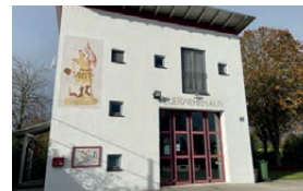
Feuerwehrhaus Hagau Rosenschwaigstraße 105