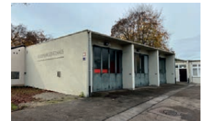
Feuerwehrhaus Ringsee Dahlienstraße 6