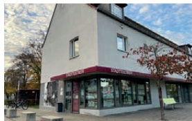
Stadtteiltreff Konradviertel Oberer Taubentalweg 65