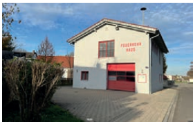
Feuerwehrhaus Pettenhofen Moosweg 9