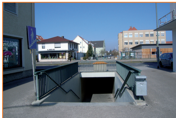
Fußgängerunterführung in der Goethestraße