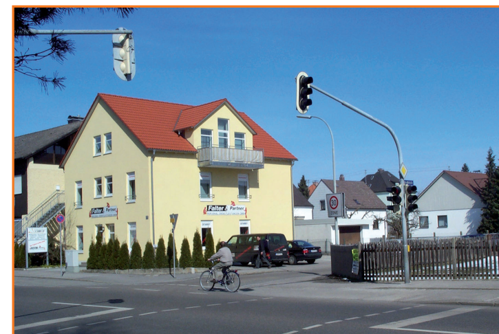
Fußgängerampel in der Schillerstraße