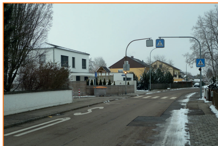
Fußgängerüberweg am Weckenweg