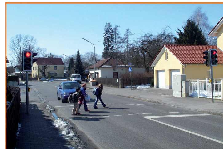
Fußgängerampel in der Beilngrieser Straße