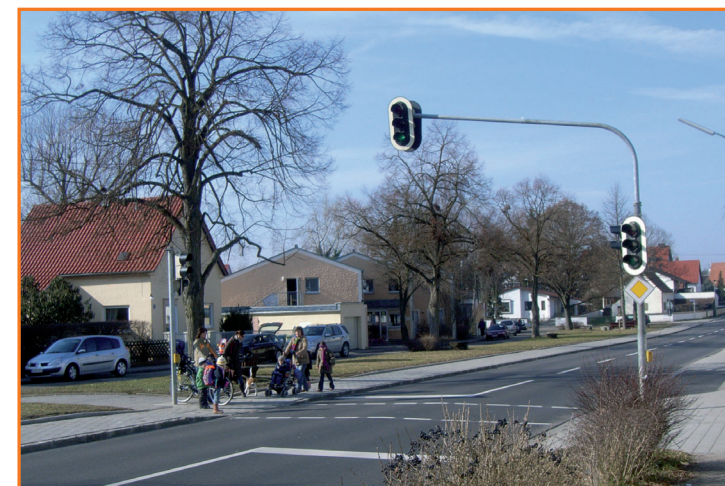
Fußgängerampel in der St.-Michael-Straße