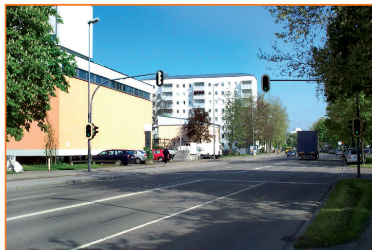
Fußgängerampel in der Ettinger Straße