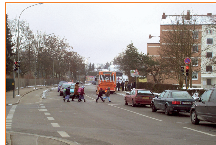
Fußgängerampel in der Gaimersheimer Straße