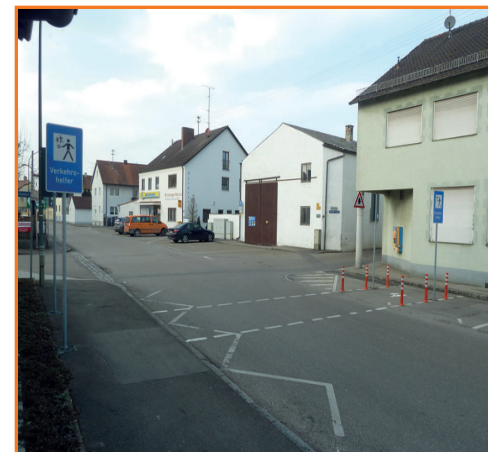
Verkehrshelferübergang in der Eichenwaldstraße