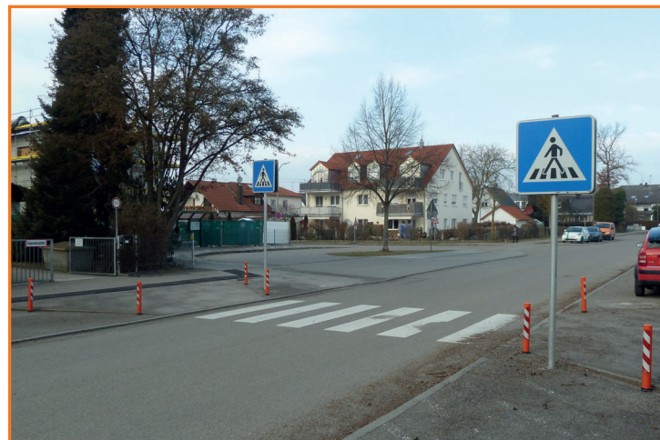
Fußgängerüberweg in der Wolfsgartenstraße