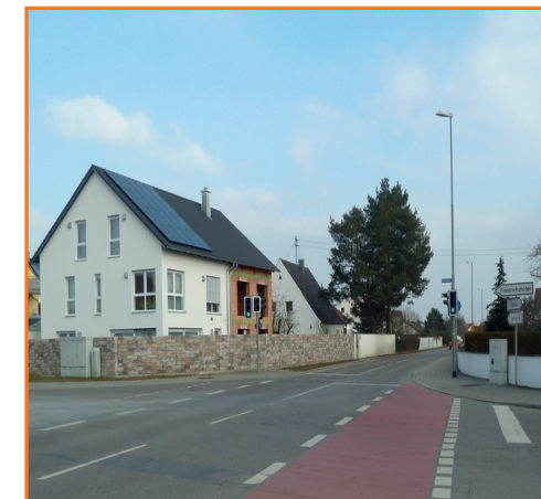
Fußgängerrampe in der Wilhelm-Busch-Straße