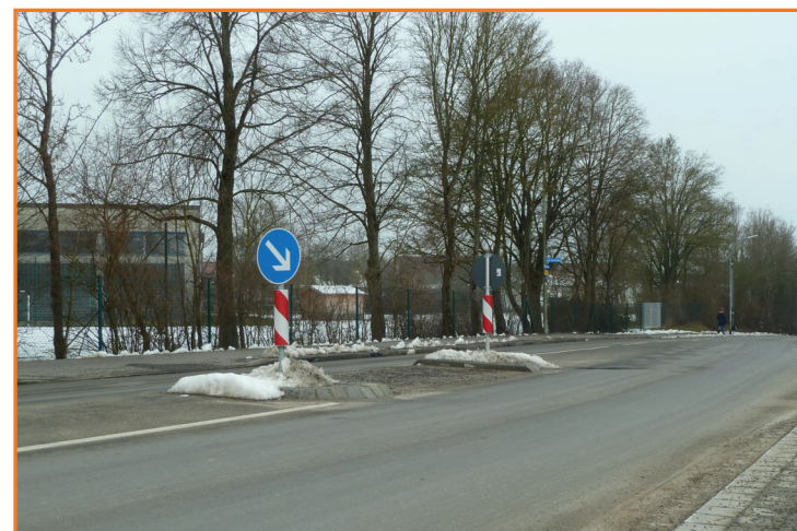
Querungshilfe in der Dreiländerstraße