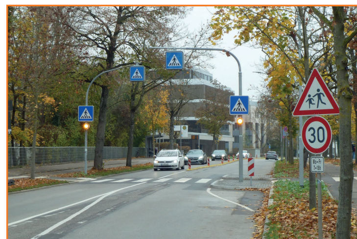
Fußgängerüberweg - Auf der Schanz