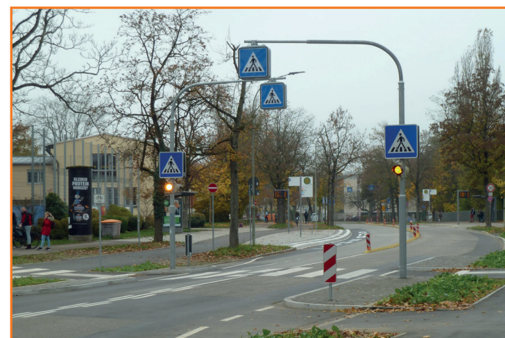
Bushaltestelle - Auf der Schanz