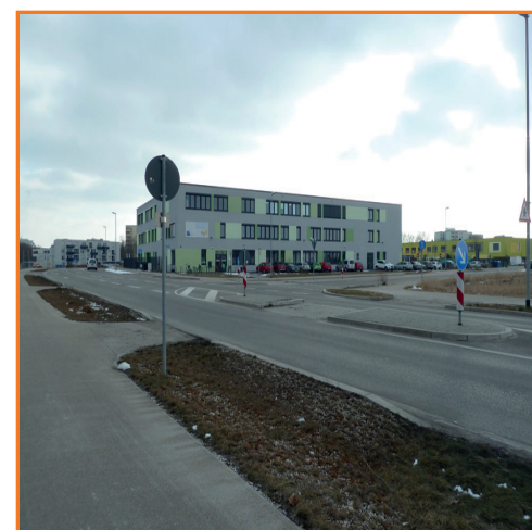
Querungshilfen in der Furtwänglerstraße