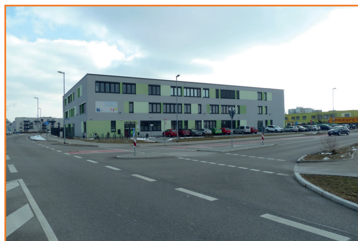
Querungshilfe in der Stinnesstraße