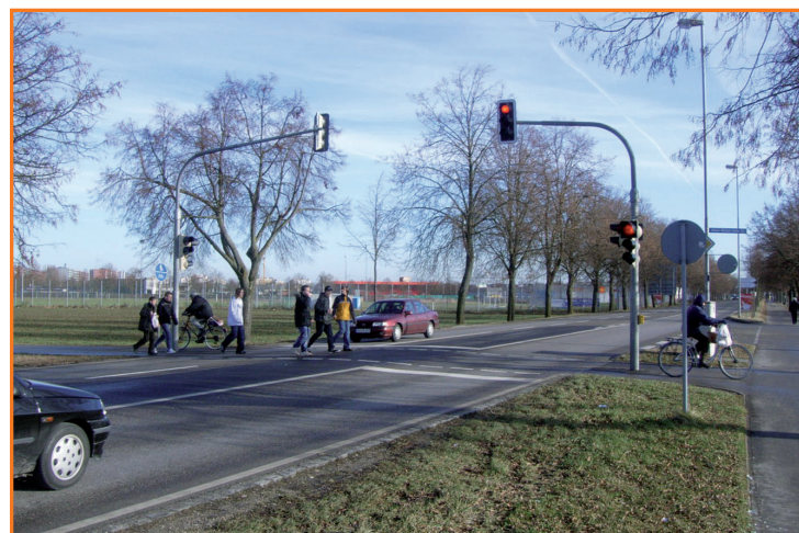
Fußgängerampel in der Neuburger Straße