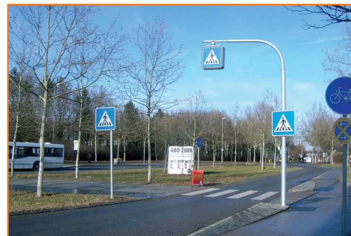
Fußgängerüberweg in der Krumenauerstraße