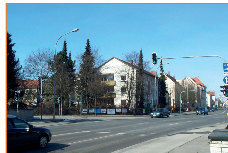
Ampel in der Friedrich-Ebert-Straße