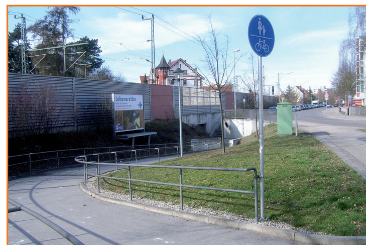
Bahnunterführung in der Frühlingstraße