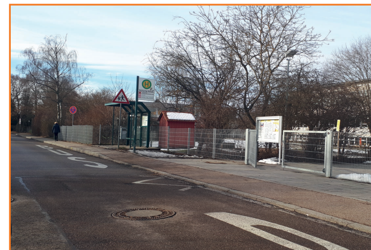
Bushaltestelle „Zuchering Schule“