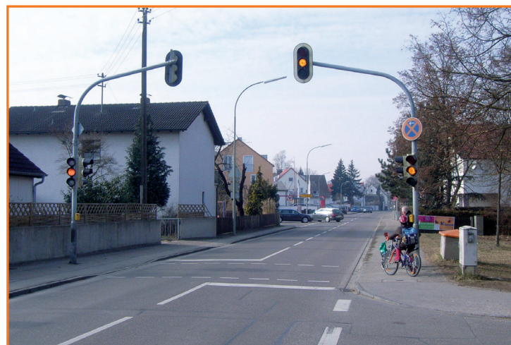
Fußgängerampel in der Weicheringer Straße