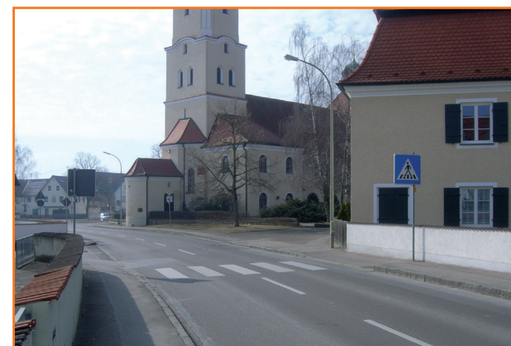
Fußgängerüberweg in der Karlskroner Straße