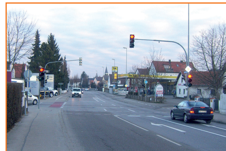
Fußgängerampel in der Münchener Straße