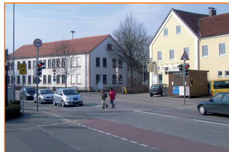
Fußgängerampel in der Münchener Straße