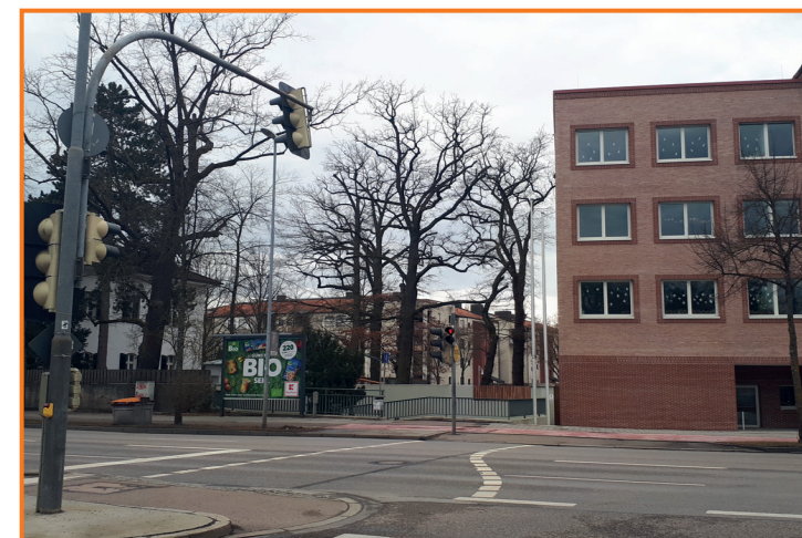
Fußgängerampel in der Münchener Straße