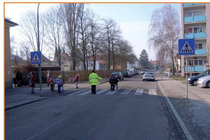
Fußgängerüberweg in der Lindberghstraße