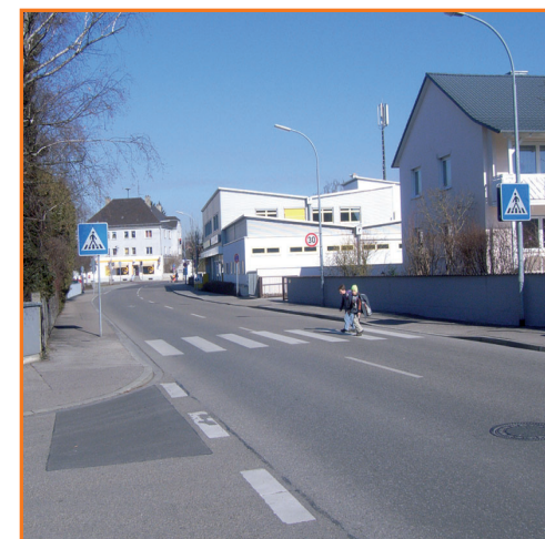
Fußgängerüberweg in der Klein-Salvator-Str. und Erletstr.