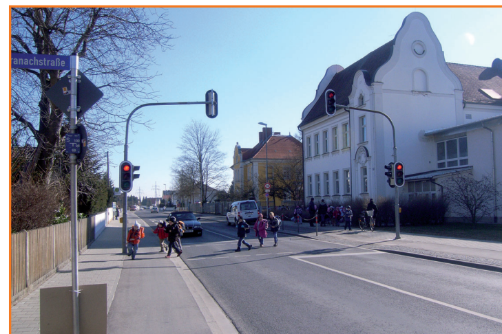
Fußgängerampel in der Geisenfelder Straße