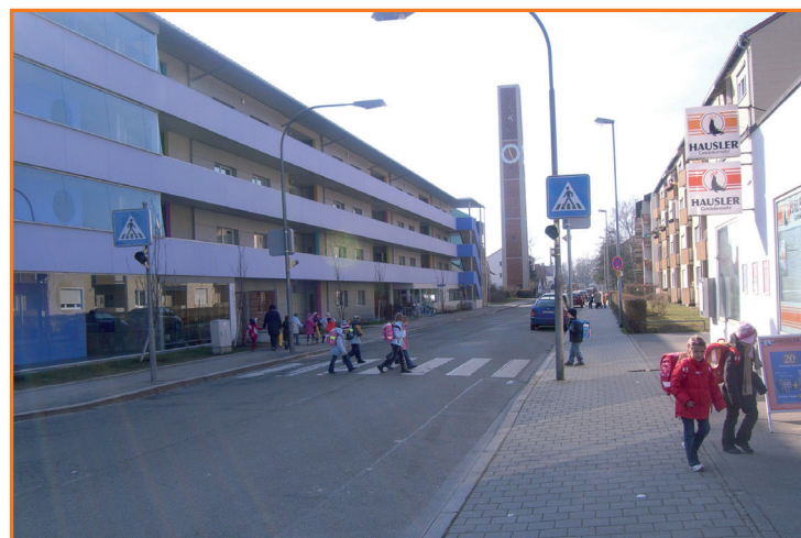
Fußgängerüberweg in der Pettenkofersstraße