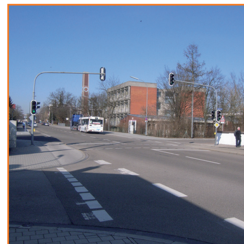
Fußgängerampel in der Feselenstraße und Manchinger Straße