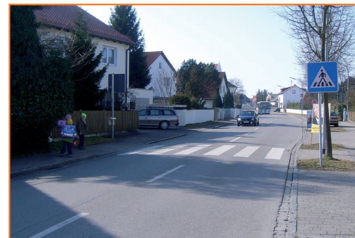
Fußgängerüberweg in der Regensburger Str.