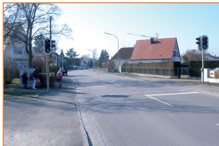
Fußgängerampel in der Regensburger Str.