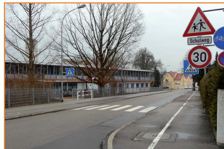
Fußgängerüberweg in der Lessingstraße