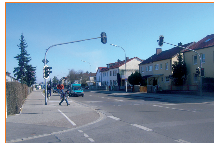
Fußgängerampel in der Regensburger Straße