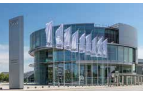
Audi Revolut F1 Team