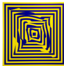
Vera Molnár, Hypertransformation Jaune-Violet A-2, 1974/2009